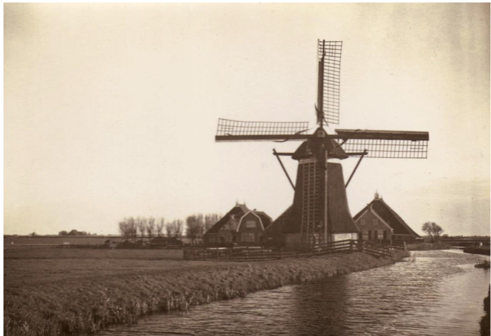
Trijehûs tusken 1926 en 1930