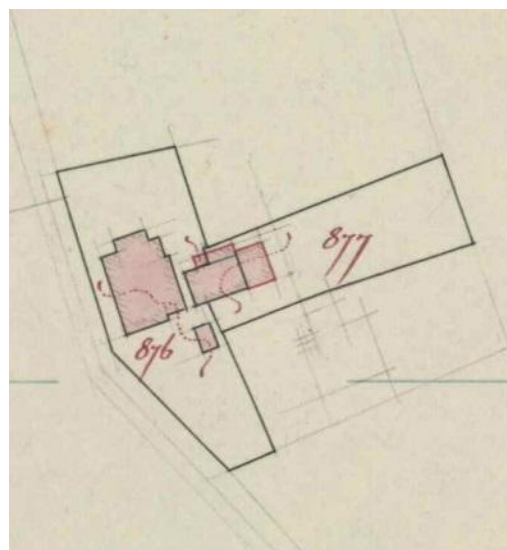
Helpkaartsje 1926, it nije hûs stiet der krekt op