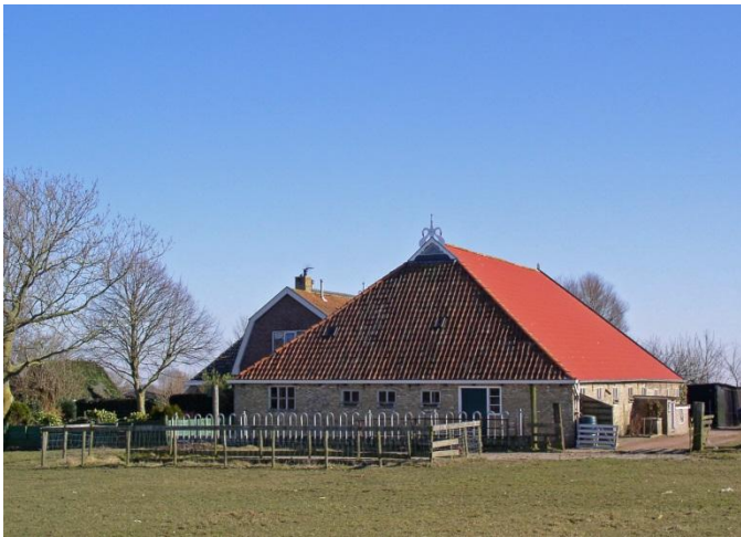
Efterkant fan de pleats yn 2007