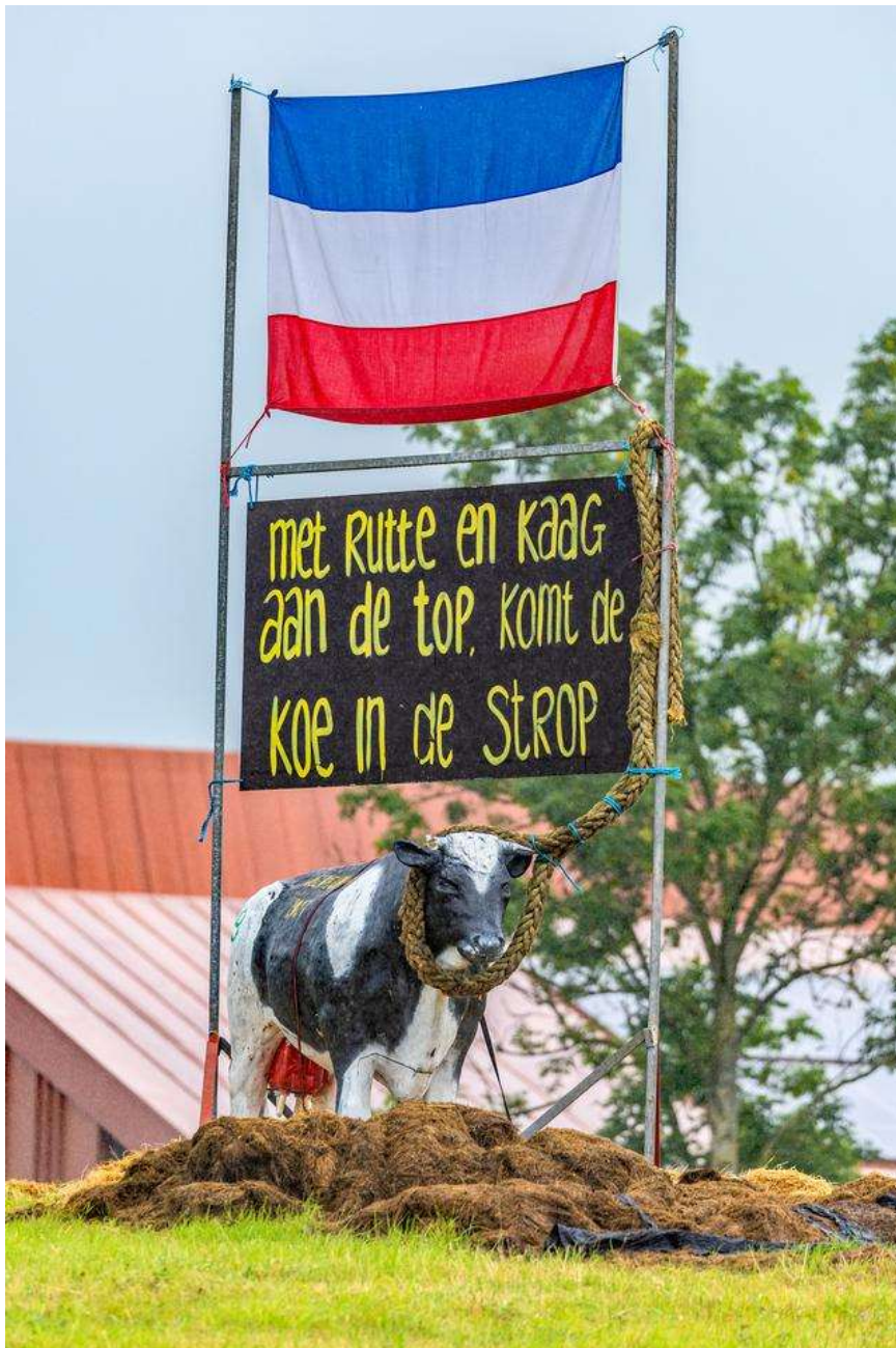
De rotonde in de Sudergoawei bij Workum in juni 2022 tijdens de boerenprotesten.

Het was in het heetst van de boerenstrijd. Melkveehouders waren woest op Den Haag en de stikstofplannen die de doodsteek zouden zijn voor de sector. Ziedende boeren voerden maandenlang felle actie met protestmarsen, trekkerblokkades en omgekeerde vlaggen. Landbouwminister Piet Adema zette vorig jaar december zijn tanden in de netelige kwestie. Een akkoord moest toekomstperspectief bieden op een duurzamere landbouw en tegelijk boeren het vooruitzicht geven dat ze een boterham konden blijven verdienen.